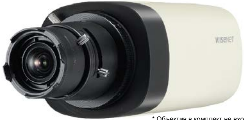
* Объектив в комплект не входит